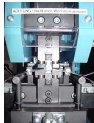
Gerät zur Lot-Depot-Erzeugung, li. Gesamtansicht, re. Detail A